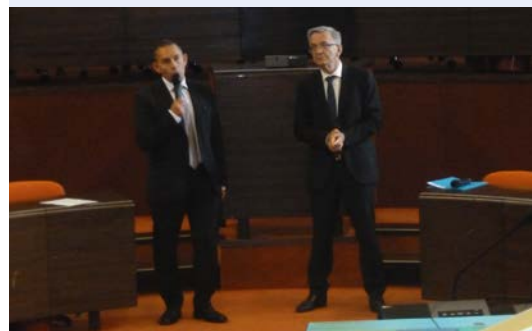
Accueil le 7 juin 2017 à l'Hémicycle du Conseil Régional par le Président François BONNEAU. Présentation officielle des résultats de l'enquête aux institutionnels par Philippe DURET, Président d'Aérocentre.

Une enquête réalisée en mars 2016 auprès des 86 membres actifs d'AÉROCENTRE a recensé leurs besoins en compétences. 58 entreprises au total ont répondu. L'enquête révèle que 511 postes sont à pourvoir (dont 64 % dans les trois prochains mois) dans les métiers suivants : opérateur (30 %), ingénieur (25 %), technicien (39 %), métiers support (6 %).