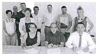
Châteauroux : se spécialiser dans l'aéronautique