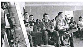
Métiers de l'aéronautique : Blaise-Pascal veut décoller