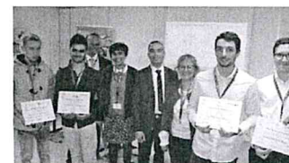
Le label qui donne des ailes à leurs diplômes