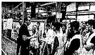
Les collégiens aux Forges de Bologne