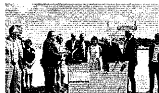
Alain Rousset aux Forges de Bologne à Parthenay